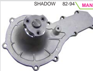
SHADOW 82-94 MANK2100 BOMBA AGUA 2.2/2.5L (SPIRIT/VOYAGER/CARAVAN)