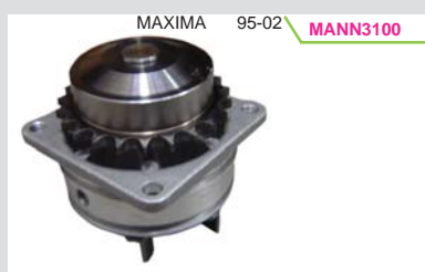
BOMBA AGUA 3.0L VQ30