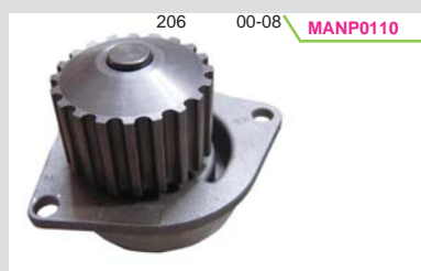
BOMBA AGUA 1.6 (306/307) 20 DIENTES