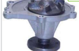
BOMBA AGUA NPW (L-18/Z-20)