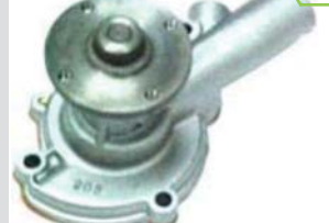
BOMBA AGUA <NPW> A-10/710