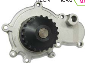
NEON 95-03 MANK0200 BOMBA AGUA 2.0L 16VAL (STRATUS)