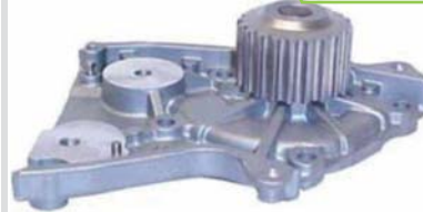
BOMBA AGUA NPW(B2200/F2L)