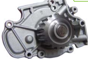
BOMBA AGUA 2.2/2.3L