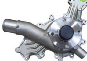
BOMBA AGUA 4.0L (AEROSTAR)