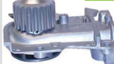
BOMBA AGUA NPW(B2000/FE)