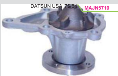
BOMBA AGUA NPW(120,210,310)