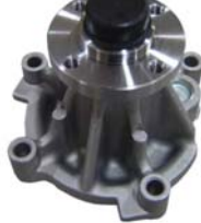
BOMBA AGUA 4.6/5.4L (EXPEDITION)