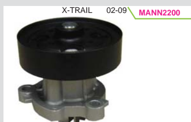
BOMBA AGUA 2.5L (MIZUMO)