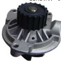
BOMBA AGUA NPW(HILUX 22R)