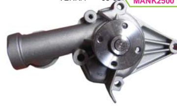
VERNA 03-05 MANK2500 BOMBA AGUA 1.5L