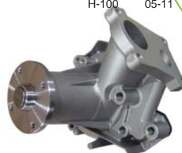
H-100 05-11 MANK1410 BOMBA AGUA 2.5L (DIESEL)