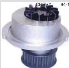
CHEVY 94-10 MANC0100 BOMBA AGUA 1.4/1.6L (MIZUMO)