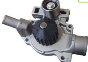
BOMBA AGUA 1.9L C/TENSOR