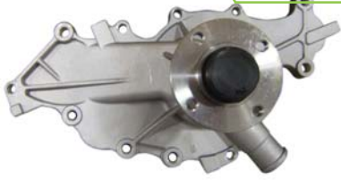
BOMBA AGUA 3.0L 183