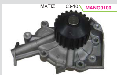
BOMBA AGUA 1.0/1.1L G1/G2 (MIZUMO)