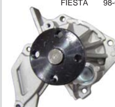
FIESTA 98-02 MANF0200 BOMBA AGUA 1.4L 16VAL.