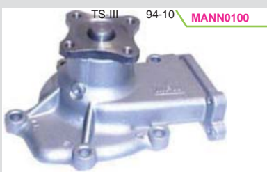
BOMBA AGUA 16VAL. (GA16) GWN-42A