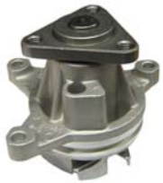
BOMBA AGUA 2.3L