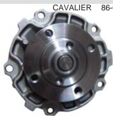
CAVALIER 86-02 MANC4800 BOMBA AGUA 2.8L 173 (CENTURY)