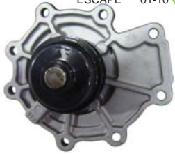
BOMBA AGUA 3.0L