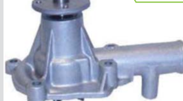
BOMBA AGUA NPW(4G52/G52B)