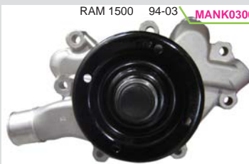
RAM 1500 94-03 MANK0300 BOMBA AGUA C/TUBO PRESION 3.9/5.2/5.9L (2500/3500/4000)