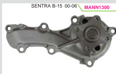
BOMBA AGUA 1.8L QG18DE (ALMERA)