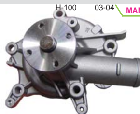
H-100 03-04 MANK1400 BOMBA AGUA 2.4L G4CS (GASOLINA)