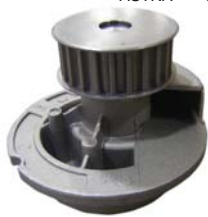
ASTRA 01-05 MANC1400 BOMBA AGUA 1.8/2.0L (VECTRA)