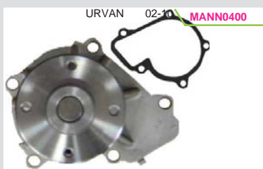
BOMBA AGUA 2.4L MIZUMO (D21/D22)KA24DE