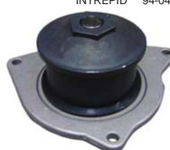
INTREPID 94-04 MANK3400 BOMBA AGUA 3.5L (CONCORDE 02-03, NEW YORKER 3.3L 92-94)