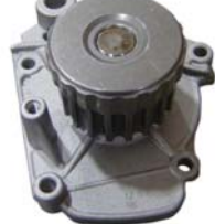
BOMBA AGUA 1.6L SOHC