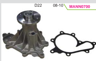
BOMBA AGUA 2.5L DIESEL YD25DD