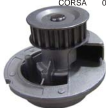
CORSA 02-08 MANC0200 BOMBA AGUA 1.8L (FIAT PALIO 1.8)