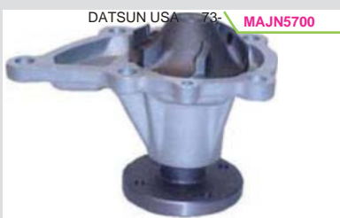
BOMBA AGUA NPW(B310/210)