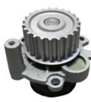
BOMBA AGUA 1.8L (MATRIX)