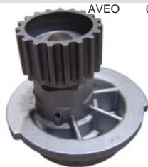
AVEO 07-10 MANC1110 BOMBA AGUA 1.6L (G3 05-10)