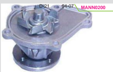
BOMBA AGUA 2.4L KA24E/KA24DE (URVAN/D22) MIZUMO