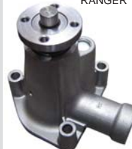
RANGER 93-98 MANF0410 BOMBA AGUA 2.3L 140/2.5L 151