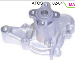
ATOS 02-04 MANK0100 BOMBA AGUA 1.0L (MIZUMO)