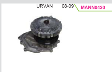
BOMBA AGUA C/FAN CLUTCH 3.0L DIESEL ZD30DD (MIZUMO)