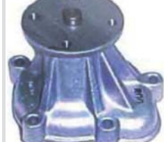
BOMBA AGUA <NPW> B.DELGADA