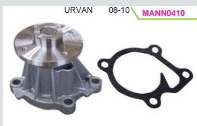
BOMBA AGUA 2.5L QR25DE (MIZUMO)