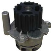
BOMBA AGUA 1.5L 1NZFE (MIZUMO)