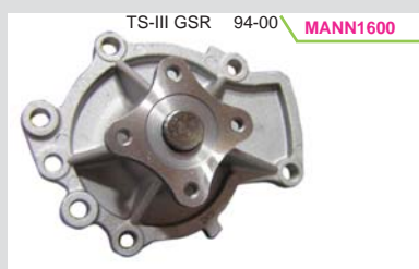
BOMBA AGUA 2.0L (SENTRA B14 GSR)