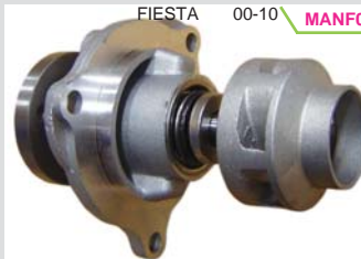
FIESTA 00-10 MANF0210 BOMBA AGUA 1.6L 16VAL. (KA)