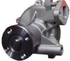
BOMBA AGUA 2.3L (GHIA)