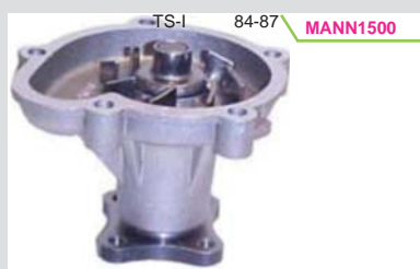
BOMBA AGUA BRIDA CHICA 1.5L (E13/15)