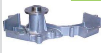
BOMBA AGUA NPW(PU VG30/V6)