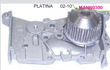
BOMBA AGUA 1.6L (APRIO) MIZUMO