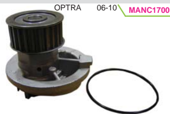
OPTRA 06-10 MANC1700 BOMBA AGUA 1.8/2.0L