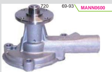
BOMBA AGUA 1.8L (DATSUN A-10/J15/16/18) MIZUMO