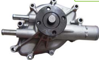
BOMBA AGUA 5.0/5.8L (F-350)