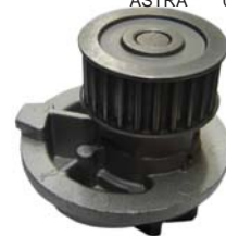
ASTRA 01-06 MANC1410 BOMBA AGUA 2.2L/2.4L (VECTRA)