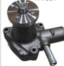
RANGER 83-92 MANF0400 BOMBA AGUA 2.0L 122/2.3L 140