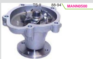
BOMBA AGUA B/GRUESA 1.6L 8VAL. E16 (TS-II)