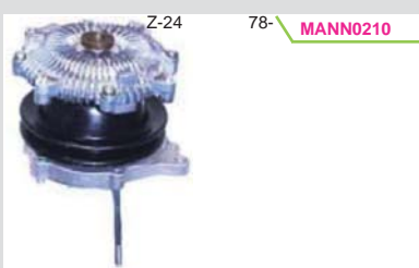
BOMBA AGUA C/FAN CLUTCH MIZUMO