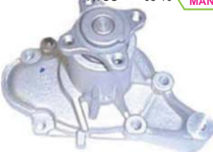
ATOS 05-10 MANK0110 BOMBA AGUA 1.1L (MIZUMO)